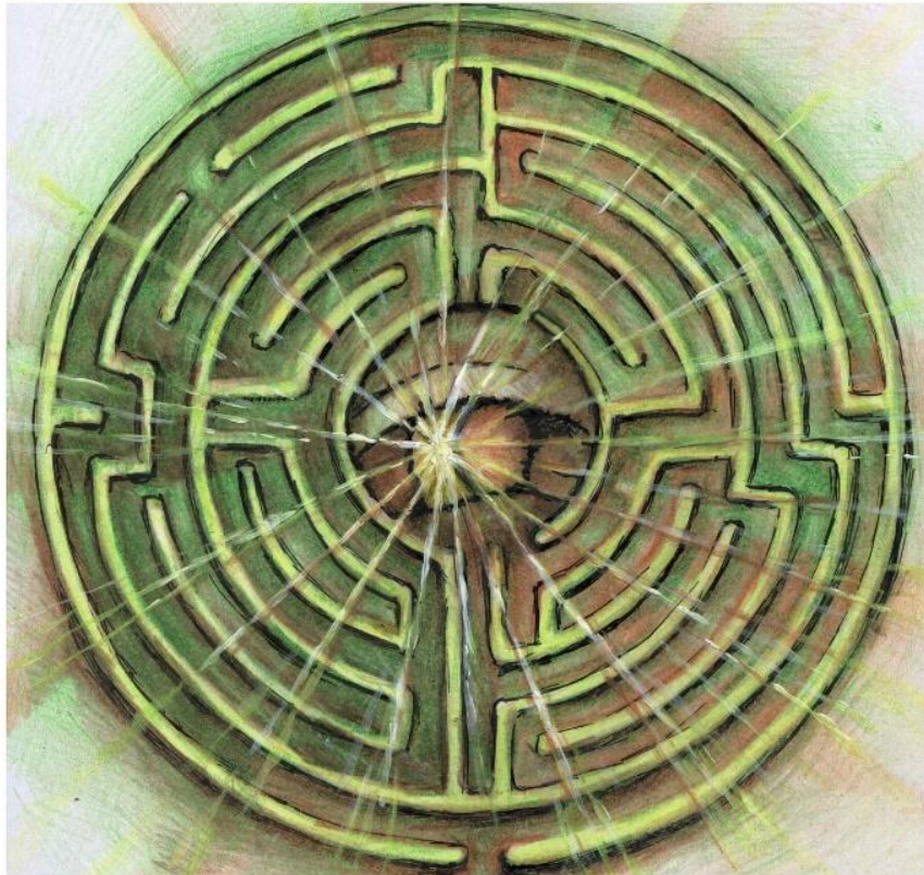
Der Weg zum Osterglauben ist manchmal ein Labyrinth, doch nie eine Sackgasse!